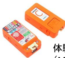
体験用機器 (M5 Stick C)