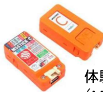
体験用機器 （M5 Stick C）

国が提唱するDX推進について何から着手したらよいか、これから検討する事業者、又は製造セクションの職場リーダーの方