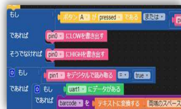
ブロックプログラミング（Scratch）